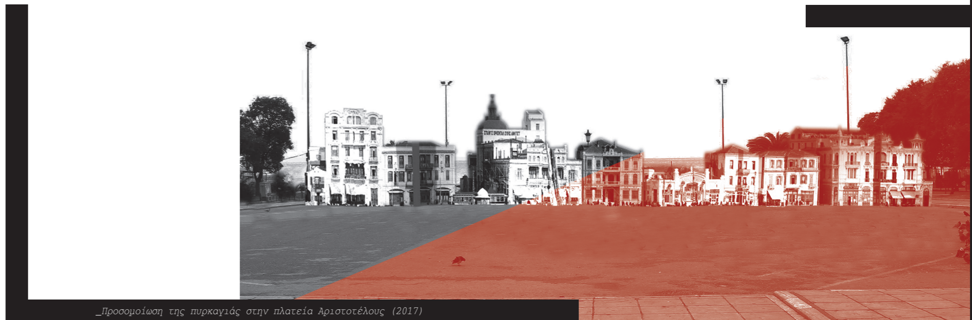
_Προσομοίωση της πυρκαγιάς στην πλατεία Αριστοτέλους (2017)