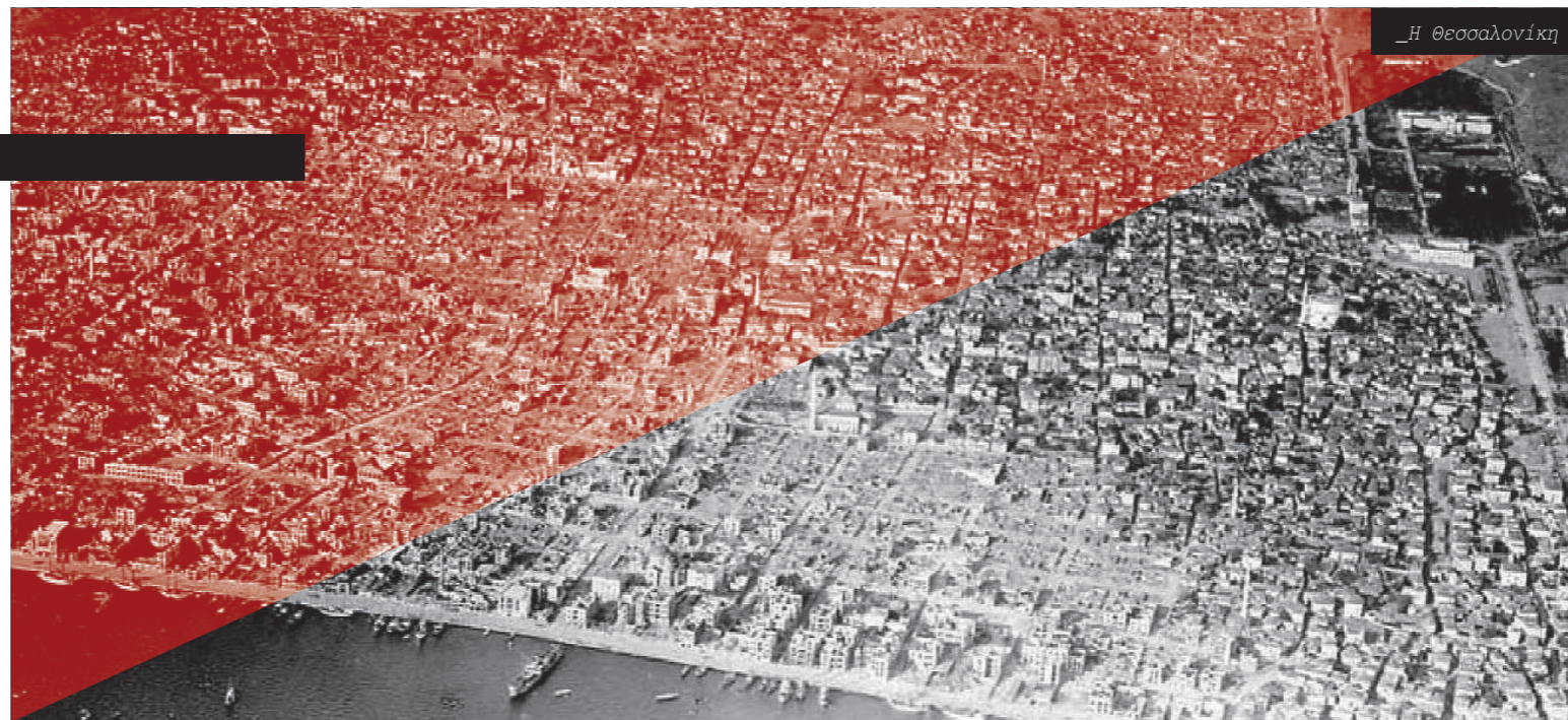
_Η Θεσσαλονίκη μετά την πυρκαγιά (1917)

τζαμιά και 3 χριστιανικοί ναοί, μεταξύ των οποίων ο αρχαίος ναός του Αγίου Δημητρίου) καταστράφηκαν ολοσχερώς. Παραδόξως δεν έχουν καταγραφεί ανθρώπινα θύματα. Η πυρκαγιά εξαφάνισε ουσιαστικά την 'ανατολίτικη' πλευρά του χαρακτήρα της πόλης και εξάλειψε τα παραδοσιακά χαρακτηριστικά που συνέχιζαν να επιβιώνουν παρά τις προηγούμενες εκσυγχρονιστικές προσπάθειες. Το σχέδιο που εκπόνησε για τη Θεσσαλονίκη η Διεθνής Επιτροπή Σχεδιασμού υπό την καθοδήγηση του γάλλου αρχιτέκτονα Ερνέστ Εμπράρ αποτελεί μια ενδιαφέρουσα εγγραφή της πολεοδομίας της εποχής στις τοπικές γεωγραφικές και ιστορικές ιδιομορφίες. Η πόλη εντός των τειχών ανασχεδιάσθηκε από την αρχή, «ως ένα λευκό χαρτί», αγνοώντας τις ποικίλες δεσμεύσεις που ο χρόνος, οι ιστορικές περιπέτειες και η μορφή της ιδιοκτησίας πάντα επιβάλλουν. Παρά τις εξαιρετικά δυσμενείς ιστορικές συνθήκες που ακολούθησαν τα πρώτα χρόνια της ανοικοδόμησης, η Θεσσαλονίκη του 1917 δεν έχασε την ευκαιρία να ανανεωθεί εκμεταλλευόμενη τα δεδομένα της καταστροφής. Τα θετικά ή αρνητικά στοιχεία του ισοζυγίου μπορεί να διαφέρουν για τον καθένα μας. Ωστόσο και μέχρι σήμερα το σχέδιο της πόλης του 1917 επιδέχεται διορθώσεις και αποδέχεται παρεμβάσεις που επιτρέπουν στον αστικό χώρο να λειτουργεί και... κάποτε-κάποτε να μας γοητεύει.