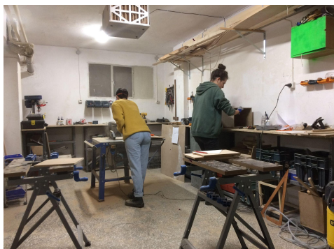
Snehta Main Space, carpentry and equipment storage space